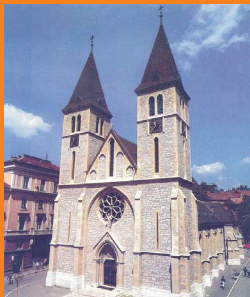
Katedrala u Sarajevu