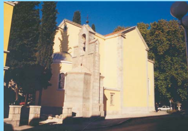
Katedrala u Trebinju

20.000 vjernika. Od početka 19. st. nema vlastitoga biskupa. Od 1890. njome upravlja biskup iz Mostara kao njezin stalni apostolski upravitelj. Na njezinu području nema sjemeništa ni sjedišta redovničkih provincija a u pastoralu djeluju samo biskupijski svećenici. Apostolski administrator biskupije je Ratko Perić.