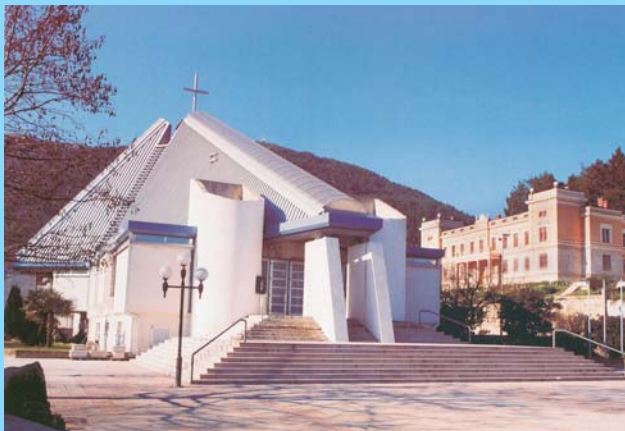
Katedrala i Biskupski ordinarijat u Mostaru

Trebinjska biskupija je najstarija ali i najmanja u BiH. Osnovana je prije 1022. Broji oko 15-